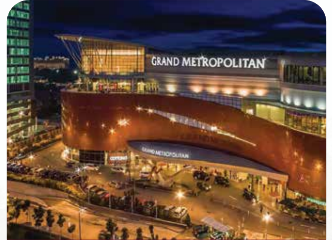
GRAND METROPOLITAN B E K A S I