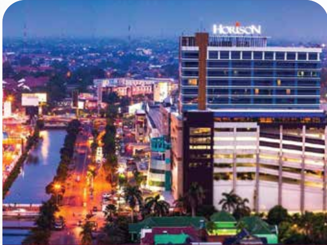
HORISON HOTEL B E K A S I