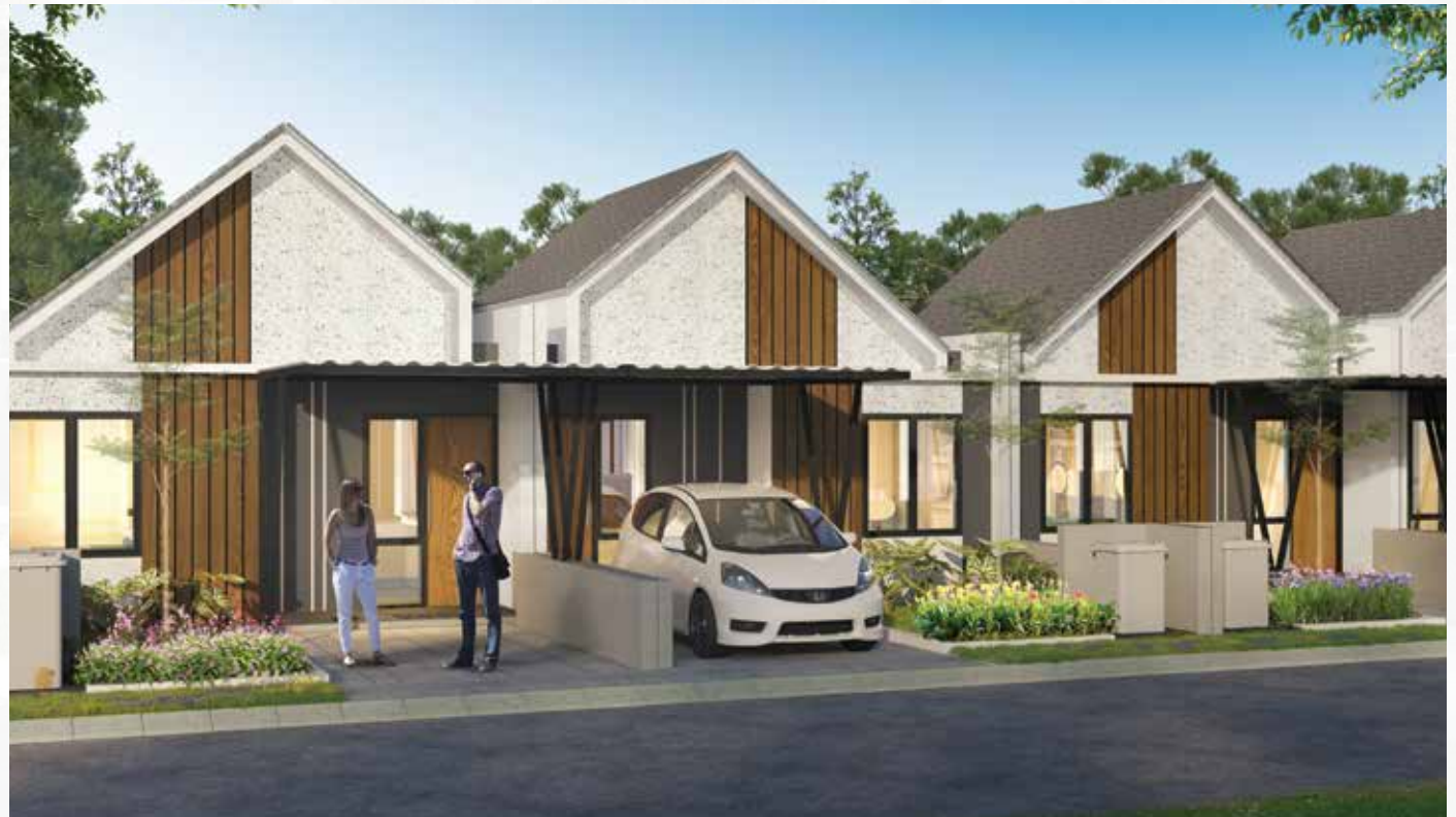
FACADE TYPE 30/60