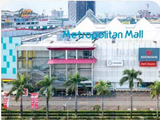
MALL METROPOLITAN B E K A S I