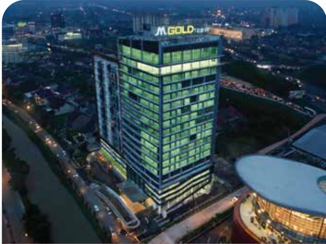
M GOLD TOWER B E K A S I