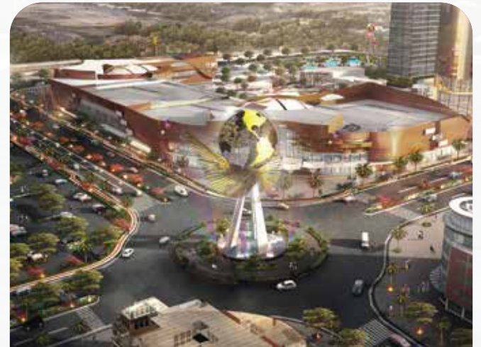
METLAND CIBITUNG B E K A S I