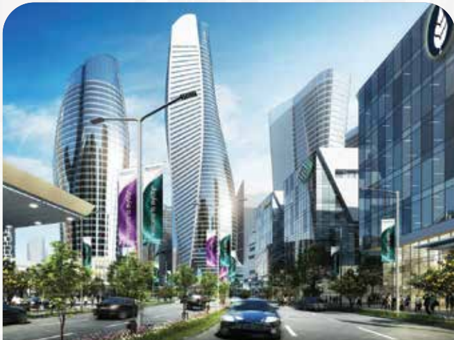
METLAND CYBER CITY T A N G E R A N G